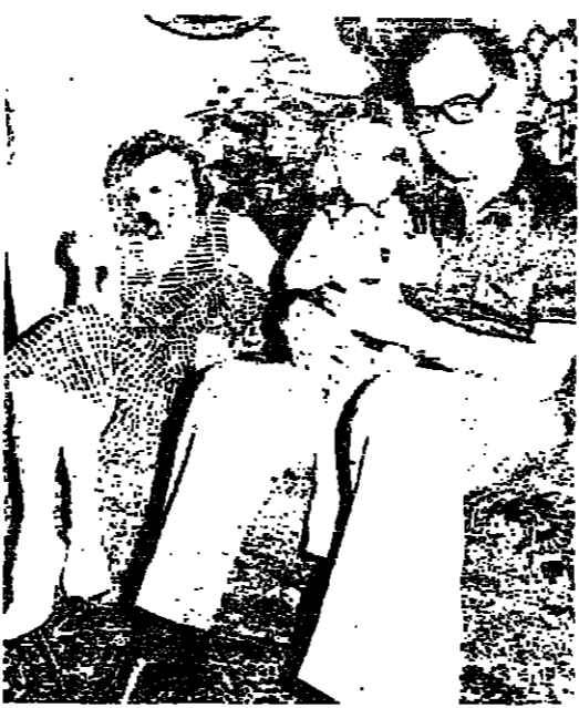
دور الرئيس الحص مع فريقه

دور السلطة في هذه المرحلة هو دور الحكم بين جيبس الفراق وعلى الجيبس أن يتولوا بحكمها . وأكد الرئيس الحص أمام بعض القربى أن عملية الإقتراب السياسي التي تمارسها بعض الفئات أصبحت في حكم القنينة ، إضافة إلى كل ذلك فإن مهمة الحكومة خلال الأشهر القليلة المقبلة ستختصر إلى حد كبير في معالجة بعض الأمور السياسية والتجهيز للبدء في عملية الحوار المنتظرة ، مع العلم أن الحكومة إذا رأت أن الضرورة ترضى وتطلب صلاحيات استثنائية تستلجها إلى مجلس النواب لفتح صلاحيات استثنائية في الموضوع « إلا أن الذي لم يسفر بعد والإعمال التي لم يبدأ بها كما جاء على لسان الرئيس الحص .